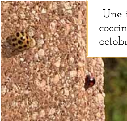
-Une invasion de coccinelles le 20 octobre