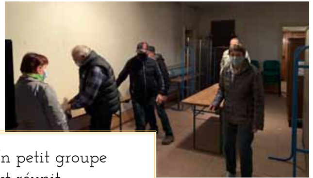
-Un petit groupe s'est réuni pour réfléchir à l'avenir du temple...