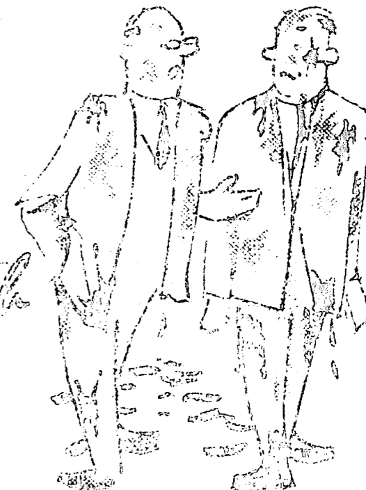
... ET TOUTES MES COLLABORATRICES SONT SANS ARRÊTE À LA CUISINE DE...