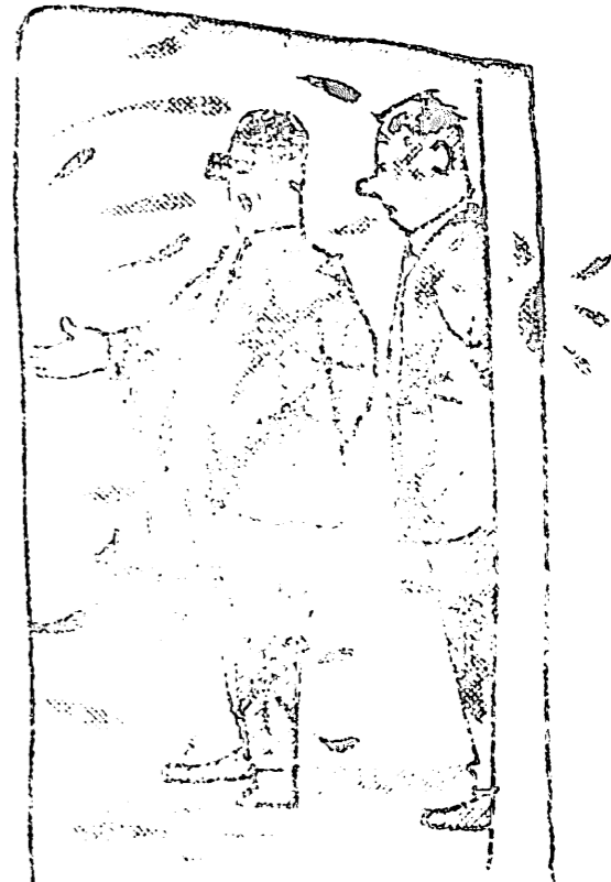
LE MEILLEUR QUE NOUS AUVONS VISITE RECENTEMENT C'EST LA CUISINE DE...

Toute l'Impression, nous en sommes persuadés, interprétera cet événement comme un signe indiscutable de renouveau et comme une raison supplémentaire d'espérer.