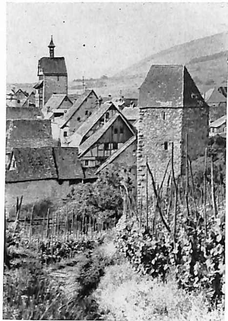
Riquewihr, le plus médiéval et le mieux conservé de tous les villages d'Alsace, est encore enfermé dans ses remparts depuis le XVII e siècle.