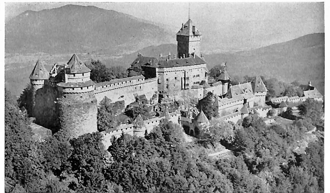
La plaine d'Alsace, étroite mais longue, encadrée par l'immense ruban du Rhin et la forêt vosgienne, apparaît dans toute sa grandeur éblouissante et sa riante séduction lorsqu'on la contemple du haut d'un de ces observatoires mystiques ou féodaux comme Ste-Odille ou le Haut-Kœnigsbourg.