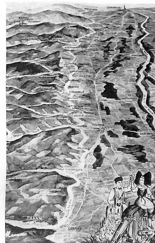
La route du vin, cet immense promenoir en bordure du Jardin d'ALSACE.

Colmar, qui raconte l'histoire du gothique alsacien, avec son église Saint-Martin, détient un des plus beaux musées de France (rétable de Mathias Grünwald). Strasbourg, sur laquelle nous allons revenir en tant que ville industrielle, a gardé du Moyen Age un